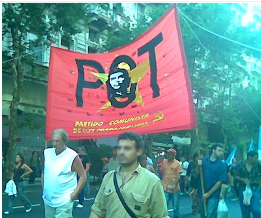
El 8 de enero se formaba la Mesa Constitutiva

Después de aquel atronador “¡Qué se vayan todos!”, no se fue nadie: los que hoy gobiernan son los mismos que contribuyeron al saqueo del patrimonio del pueblo argentino. Los verdaderos autores intelectuales y beneficiarios del genocidio y las políticas económicas surgidas de él, pasean soberbios su impunidad y aumentan cada día su poder y sus ganancias. Sin embargo, esa recomposición la han logrado de la manera que aquel estallido y sus secuelas les permitieron